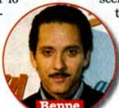
Beppe Fiorello, 44

«È stato un ritorno alla mia infanzia che mi ha regalato grandi emozioni. Alcune scene le abbiamo girate anche nella zona dove abitavo da bambino, e questo mi ha dato l'opportunità di riabbracciare persone che non vedevo da tempo, vecchi amici di mio padre che si ricordavano di me e delle mie partite a calcetto nel cortile. Sono contento che Beppe Fiorello, che è anche produttore della fiction, abbia deciso di dare spazio a una realtà come quella di Scampia, che non è solo negativa. Lì, ci sono tante persone oneste nonostante le difficoltà».